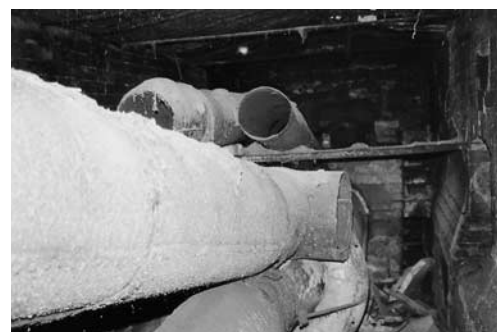
Obr. 1. Semín (okres Pardubice), pivovar, hvozduvalach po vyklizení. Vpravo schody do psinku. Vlevo nahoře odvětrávací průduchy.