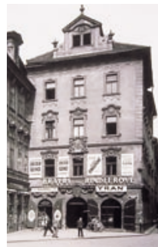
Obr. 1. Praha, Staroměstské náměstí, dům U Kamenného zvonu, stav na počátku 20. století.

8 Tehdejší osmdesátimilionová vládní rozpočtová rezerva, uvolňovaná od roku 1973 každoročně na obnovu památek, byla většinou spotřebována na nesmyslně drahé, dotčené památky v jejich autenticitě těžce poškozující sanační akce, jakými bylo vybetonování podzemních chodeb